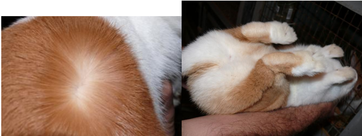
Een mooie diepe oranje kleur zie je bij het inblazen. De staart van deze voedster is roomwit zoals gewenst.

In November vind de grote selectie plaats. Peter kijkt niet naar aantallen, maar vooral naar de kwaliteit. De verhouding rammen en voedsters probeert hij gelijk te houden. Op deze manier is er altijd iets onverwants te vinden in de eigen stal, indien dat nodig is. De achterhanden nemen af bij (foutieve) lijnenteelt. Het is dus belangrijk niet te lang door te gaan in 1 lijn. Dit is heel belangrijk als je met iets "nieuws" bezig bent. Peter heeft kritisch leren kijken door echt op bouw vanuit de standaard de eigen dieren te beoordelen en zo vooruit te komen en de kwaliteit die er is vast te houden.